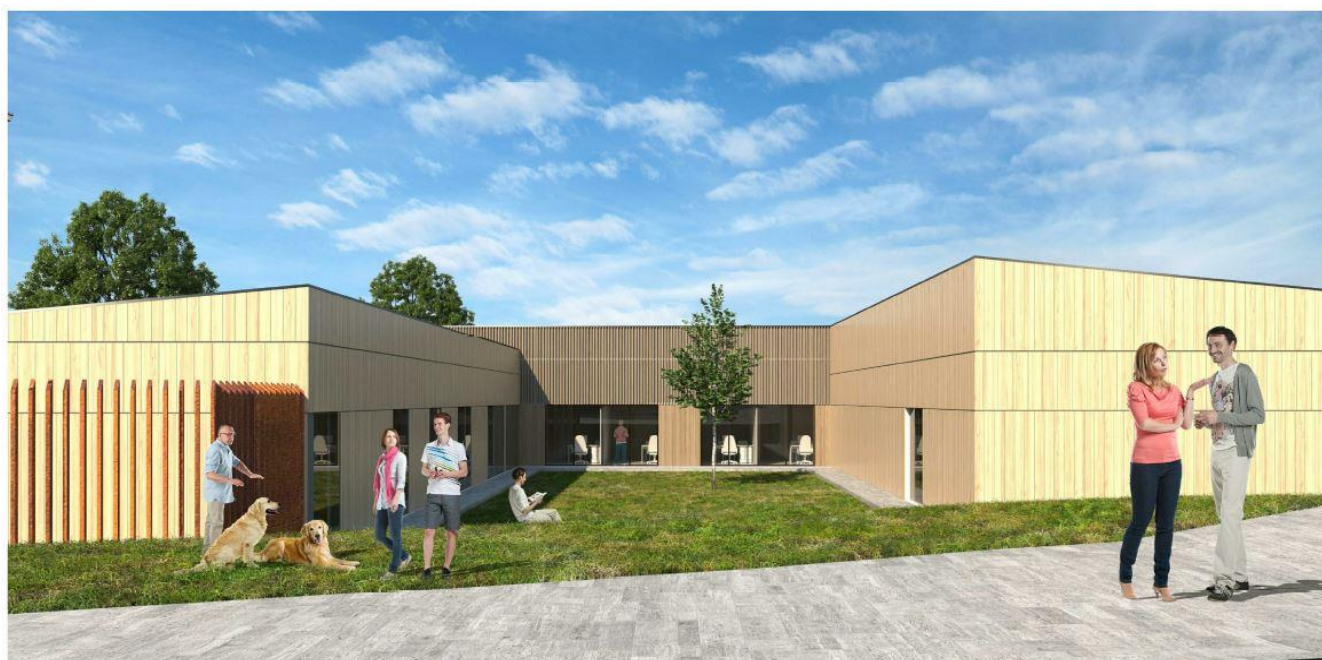
VISTA DELLA CORTE CENTRALE DELL'EDIFICIO