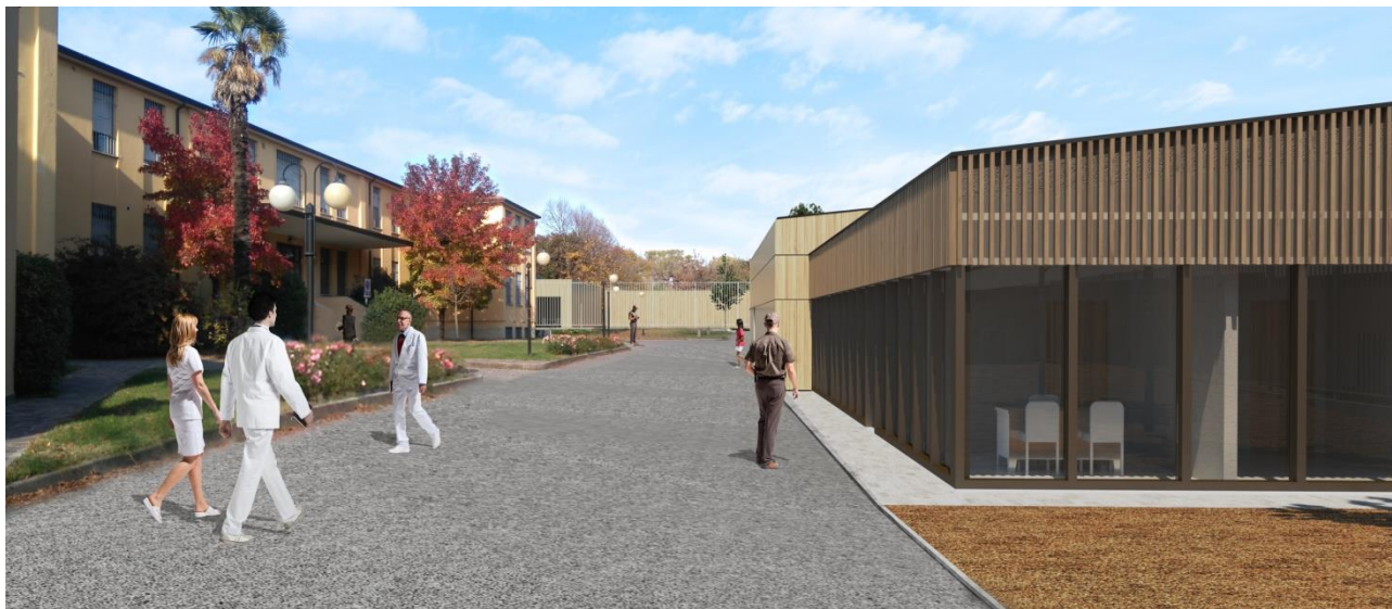
VISTA DELL'AREA DI INTERVENTO - CORPO DI INGRESSO RISERVATO AL PUBBLICO