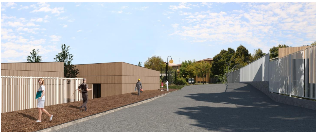
VISTA DELL'AREA DI INTERVENTO - CORTE CENTRALE DELL'EDIFICIO